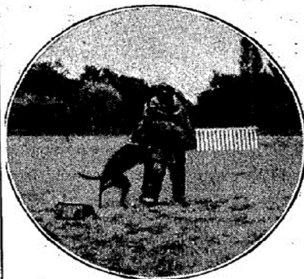
Chien Beauceron dressé en chien de défense.

C'est un conducteur de troupeaux remarquable par atavisme, mais il a facilement la dent un peu dure; aussi, sans dressage préalable, l'emploi-t-on de préférence pour la conduite des bêtes à cornes. Il est très vigoureux et infatigable.