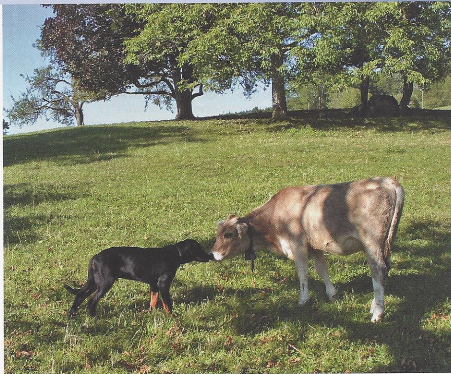
Le beauceron est l'une des plus anciennes races de France. Ce grand chien puissant excelle dans la protection des troupeaux. Sur notre photo: Angus de Sartigny.