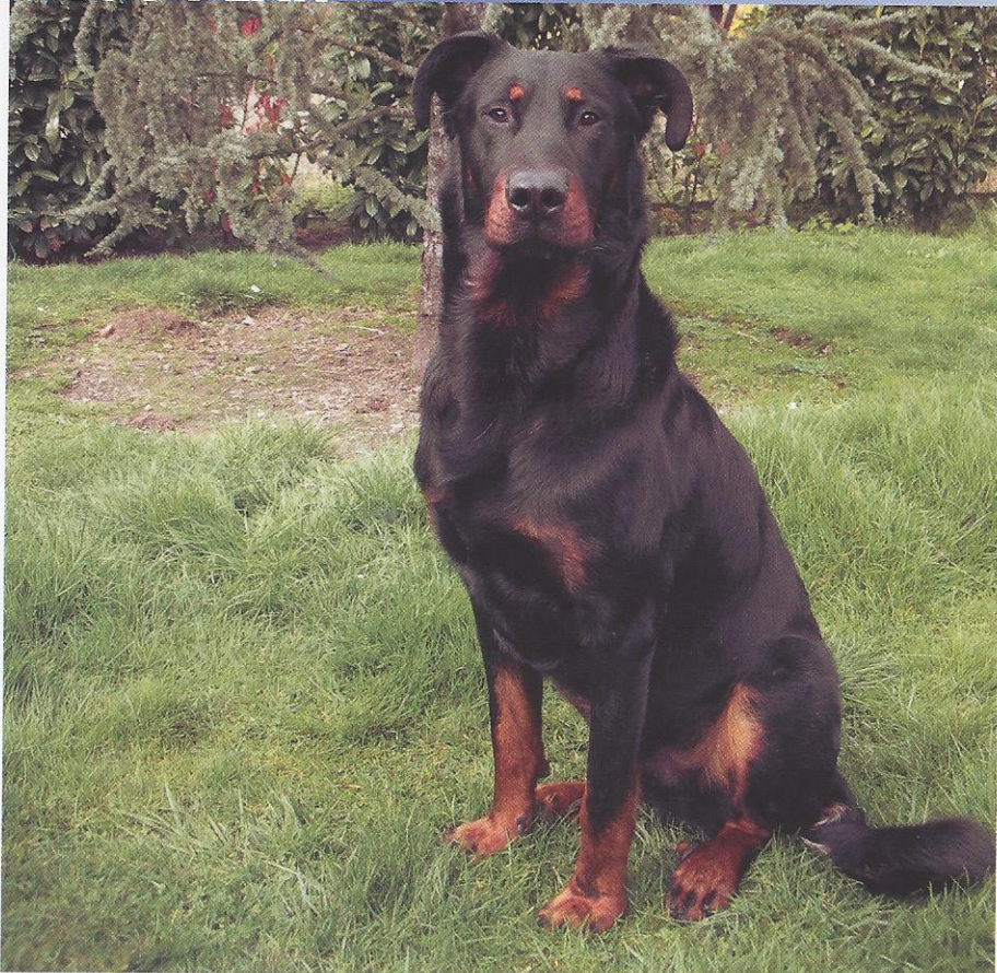
Benjee du Manoir de Varembo.