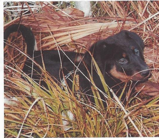
Chandra du Manoir de Varembo.