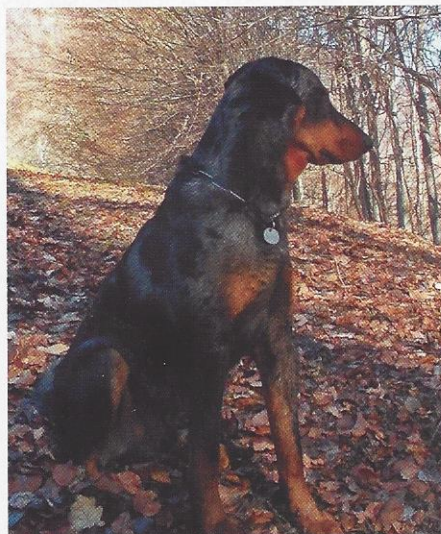
Drakkar, beauceron à la robe arlequin.