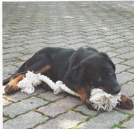
Angus de Sartigny, lorsqu'il jouait encore dans la classe des petits!