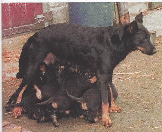
Vicky du Domaine d'Epalais et ses chiots.