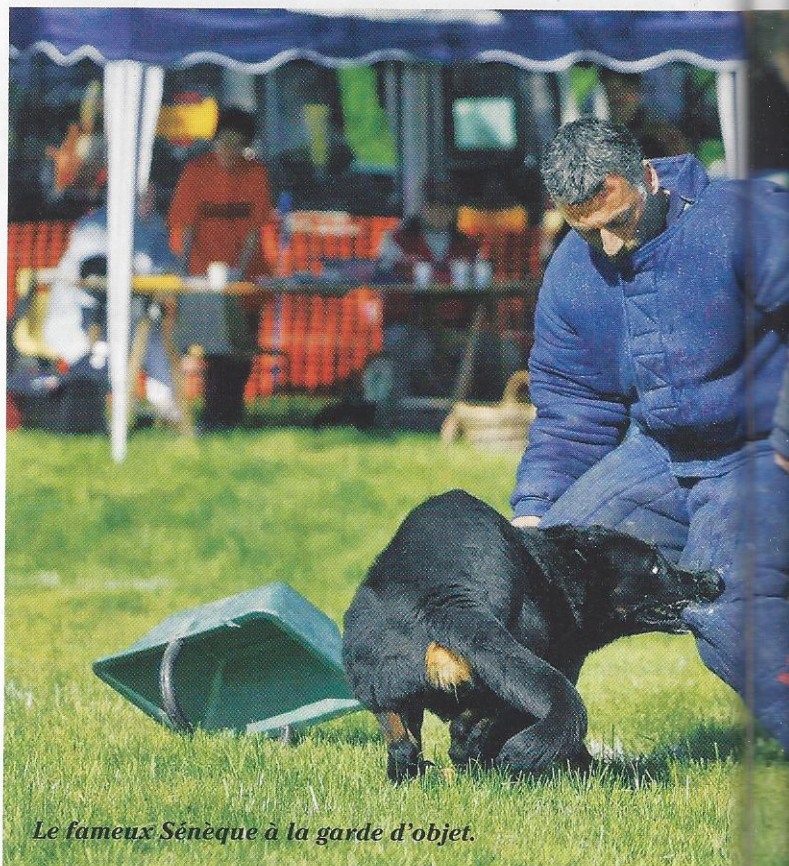
Le fameux Seneque à la garde d'objet.

En pistage, Roll's du Murier de Sordeille (recommandée) CHTP en 2008, championne régionale, remporte le