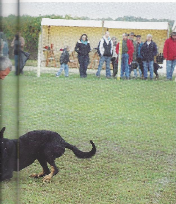
Alioth du Haut Marais.