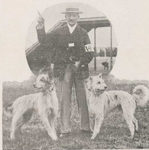
CARTOUCHE ET FARAUD, A M. PILLETTE, 2 e PRIX D'HONNEUR (CONCOURS DE TRAVAIL)

Quoiqu'il en soit, plusieurs bergers et conducteurs aussi bien au commencement qu'à la fin ont effectué leur travail très