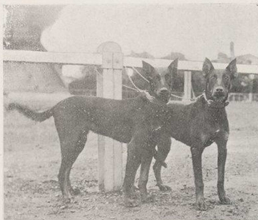
FAPIDE ET CARABINE, PUPES BEAUZERONS A M. LEROUX PRIX D'ÉLEVAGE

Et cependant combien de fois le programme n'a-t-il pas eu à subir l'assaut de la critique ? Le nombre des mal contents est élevé, ceux-ci trouvent qu'il n'y a pas assez de bêtes à mener,