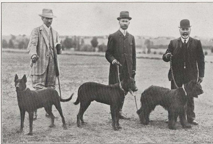
Thau à M. Luizard

Le Concours Hippique international organisé par la Société d'Encouragement de l'élevage des chevaux aux Pays-Bas, aura lieu du 6 au 12 juillet au Parc Zorgvliet de la Haye Schéveningue. Les engagements seront reçus jusqu'au 29 juin chez le Commissaire délégué, M. A. Van Hoboken, Willemstraat, 54, La Haye.