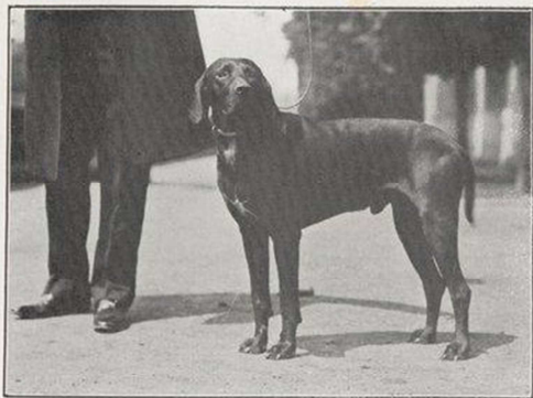
BLACK BOY DE BRETAGNE, POINTER, 1 er PRIX (CL. INTERN le PETITE TAILLE) AU COMTE DE GOULAINÉ