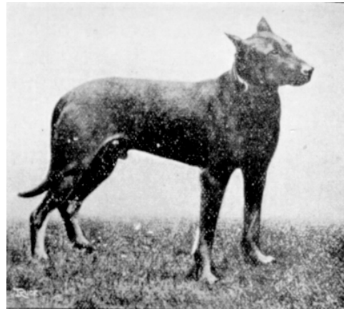
Beauceronrüde »Fauchon« (Rasquin)

liche Arbeit nicht geeignet, die Besitzer wissen auch, dass ein zu grosser und imposanter Hund nicht so zufriedenstellend arbeitet wie ein kleinerer.«