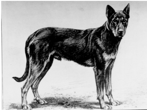
Beauceron »Voltigeur« (Bylandt - 1904)

ten Afterkrallen, die heute vom Standard als untrügliches Zeichen der Rassereinheit gefordert werden, mit keiner Silbe erwähnt werden. Erstmals in der deutschsprachigen Literatur beschreibt Ludwig Beckmann 1895 in seinem Buch »Geschichte und Beschreibung der Rassen des Hundes« den Beauceron. Fast wörtlich schreibt er bei Mégnin ab und weiss als einziger Autor zu berichten, dass der Beauceron »in einigen Departements zu Saujagen verwendet wird.«