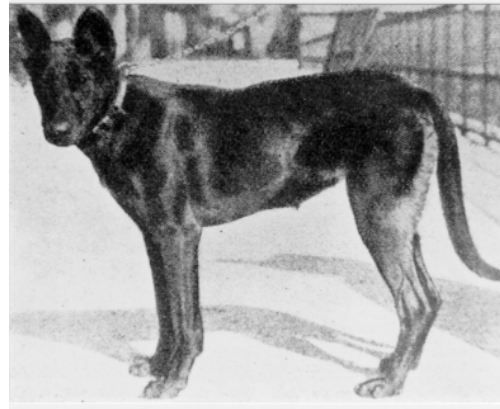
Beuceron »Brissac« (Bylandt - 1904)

1895 veröffentlichte E. Boulet ebenfalls die