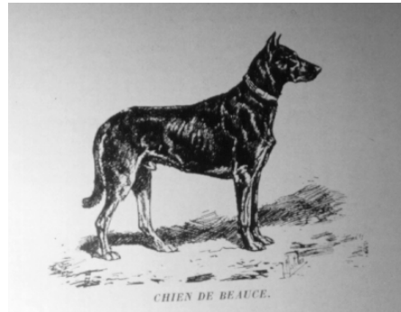
Chien de Beauce (Dechambre - 1921)

das wichtigste Zuchtkriterium, das alle andern Qualitäten aufwiegt. (...) Ein Arbeitshund mit mittlerer Schulterhöhe ist vorzuziehen, da die grossen Hunde oftmals weich und phlegmatisch sind.«